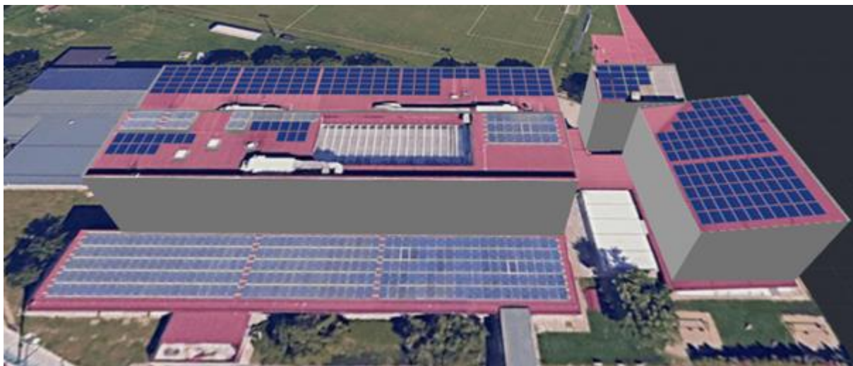
Slika 1: Lokacija postavitve FVE – OŠ Duplek

Fotonapetostni generator je nameščen na strehi objekta na parc. št. 833/3, k.o. 692 - Spodnji Duplek.